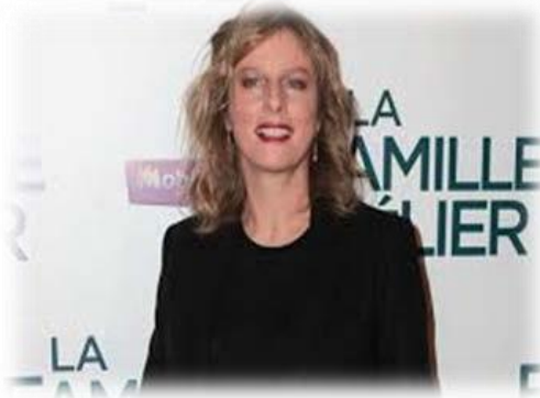
Actrice du film « la famille Bélier »

3) Parlez des goûts de Karin Viard, l'actrice du film « La famille Bélier » en utilisant la troisième personne du singulier. Servez-vous des informations ci-dessous