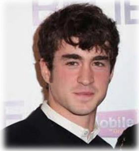
Acteur du film « la famille Bélier »