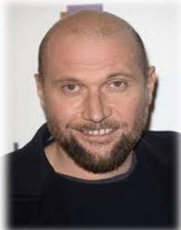
Acteur du film « la famille Bélier »

2) Décrivez François Damiens, acteur du film « La famille Bélier » à la troisième personne du singulier. Servez-vous des informations ci-dessous :